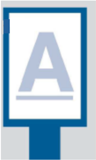
Failas pateikiamas vertikalia forma